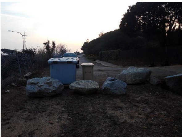
Marge sud del requadre marcat en els plànols