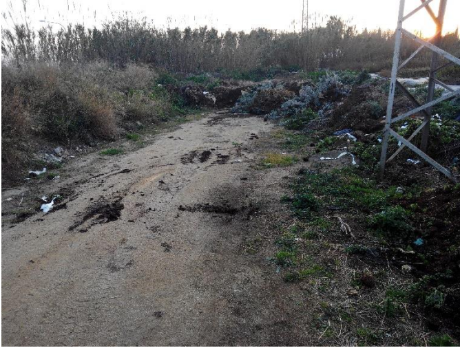
Marge nord del requadre marcat en els plànols